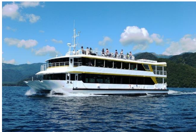
【船舶 男体】2017年8月10日就航